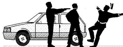
3 Al menos uno de los activistas se encara con el agente y le dispara dos tiros a bocajarro en la cabeza que le ocasionan la muerte de forma inmediata