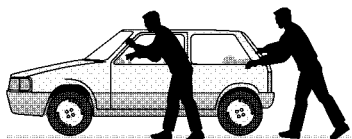
1 Dos jóvenes empujan un Fiat rojo, aparentemente averiado, por el lateral montaña de la Diagonal, a escasos metros del cruce con Numància. Detrás de ellos empieza a formarse un atasco

El guardia urbano Juan Miguel Gervilla pierde la vida, tras recibir dos disparos a quemarropa, en la avenida Diagonal. El agente se había acercado a dos individuos al ver que empujaban un vehículo averiado que resultó ser un coche bomba