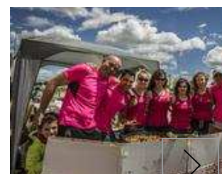
📷 Fiestas en Valdeg