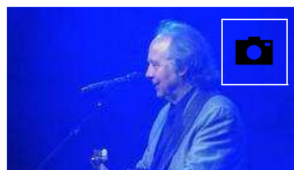
📷 Serrat encandila al público de Logroño