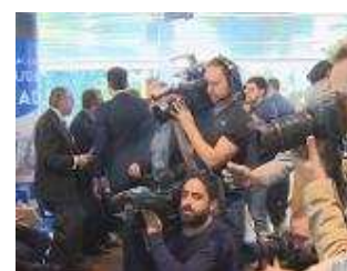
▶ Concha Velasco recibe Medalla de Oro de M

Utilizamos "cookies" propias y de terceros para elaborar información estadística y mostrarle publicidad, contenidos y servicios personalizados a través del análisis de su navegación. Si continúa navegando acepta su uso. Más información y cambio de configuración. ACEPTAR