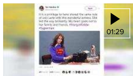
▶ Hollywood despide a Margot Kidder a través de Twitter