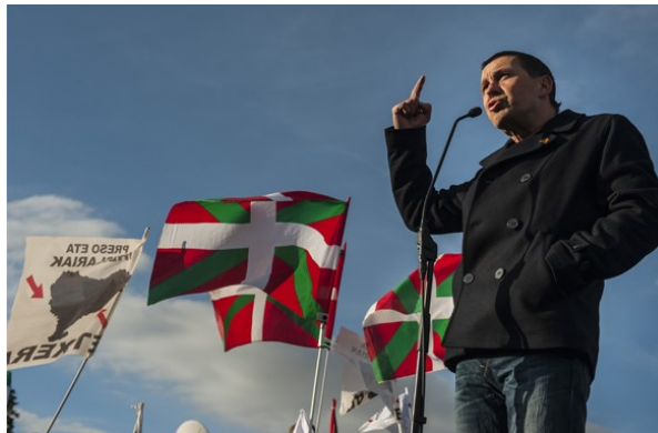
Arnaldo Otegi pronuncia un discurso a sus seguidores fuera de la prisión de Logroño el martes 1 de marzo de 2016.

Hay tanta hipocresía, hay tanta maldad, hay tanto sectarismo en el proyecto totalitario defendido por Herri Batasuna y que defiende ahora EH Bildu que desde luego nos vamos a morir en esta tierra estando en contra de él y no dejándonos llevar a un terreno que es impropio del siglo XX en una Europa que ha sido, si hay algún continente en el mundo Europa lo es, la tierra de los horrores más inhumanos que puede cometer el humano. Me refiero al terrorismo, obviamente, que es el señalar, el perseguir y finalmente aplicar la última solución, la solución final, que es la muerte.