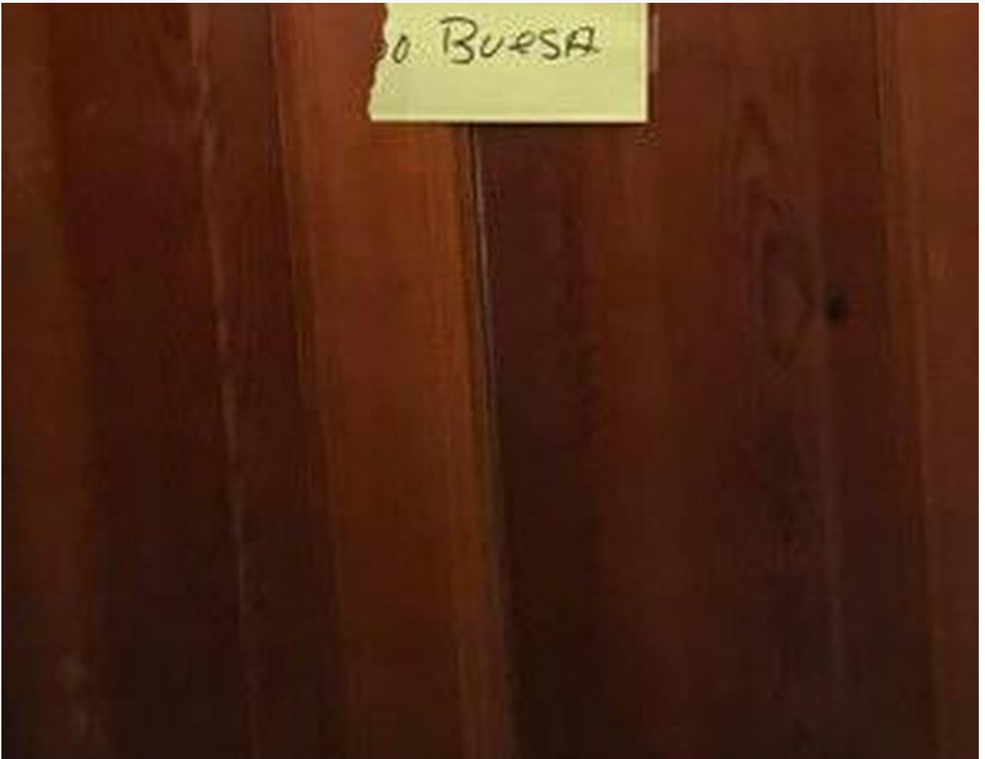
Uno de los carteles puestos por el profesor en la sala donde se impartió la charla.