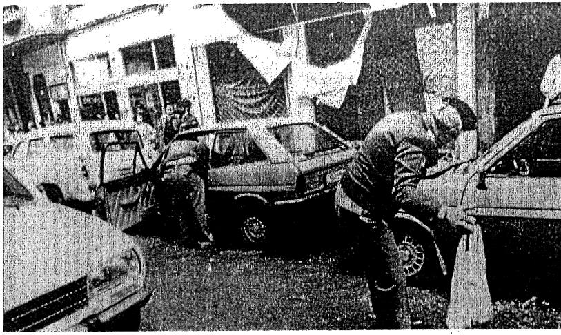
Un policía recoge restos en el lugar del atentado, el 27 de marzo de 1983.