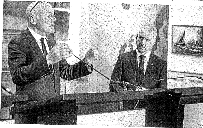
Alain Rousset y e Iñigo Urkullu, en la rueda de prensa tras la asamblea de la Euroregión el pasado lunes.