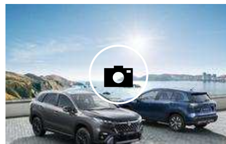
📷 Suzuki Vitara y S-Cross: la hibridación y la eficiencia con aptitudes todo terreno