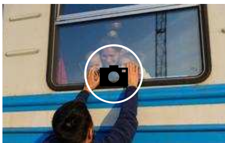
📷 El vigésimoprimer día de guerra en Ucrania, en imágenes