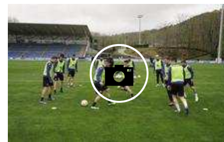
📷 Entrenamiento sin Aihen ni Silva