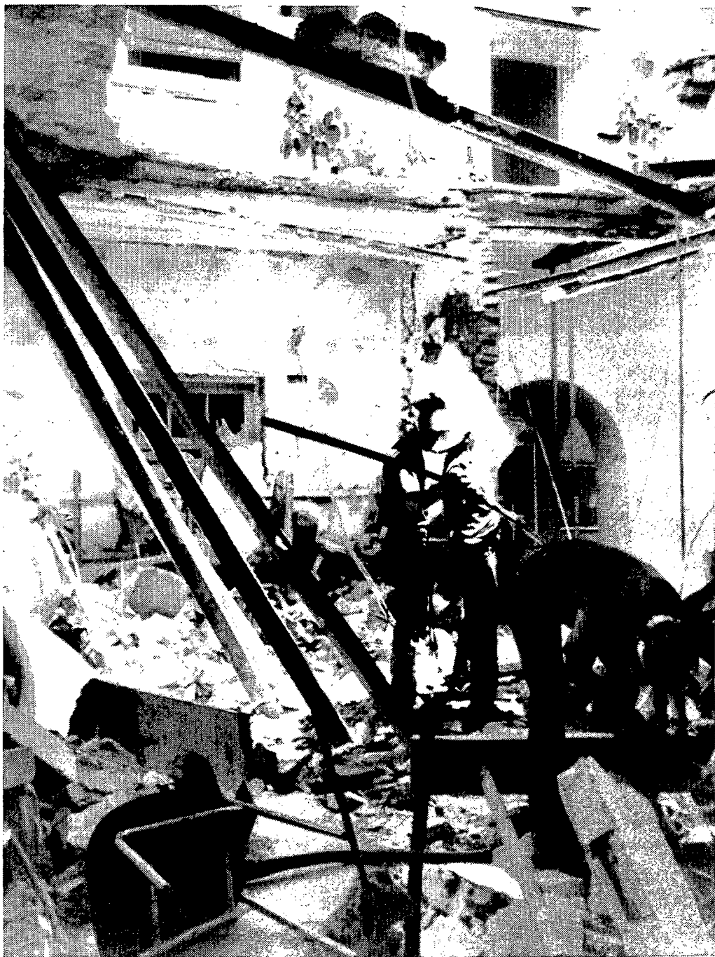
Los bomberos trabajan en una de las dependencias afectadas por la explosión

El Ministerio de Justicia ordenó ayer el aislamiento de los presos de bandas terroristas para evitar que los reclusos comunes tomen represalias contra ellos tras el atentado de Sevilla. Con esta medida preventiva se intenta evitar que los presos comunes se enfrenten a terroristas y se produzcan linchamientos o disturbios en los centros penitenciarios. ●