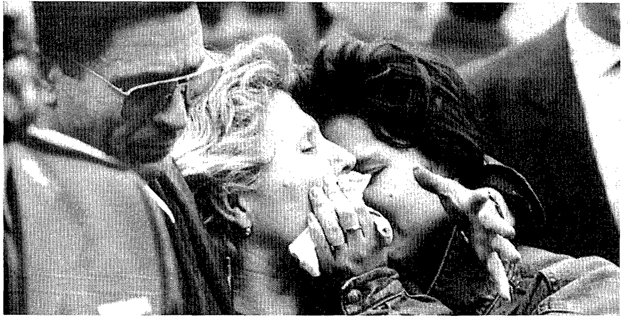
Los padres y la hermana del guardia civil asesinado en el puerto de Pasajes siguen al féretro con gestos de dolor

años. En un mensaje leído en el funeral del guardia civil asesinado, el obispo donostiarra expresó su repulsa y condena por el atentado, al tiempo que afirmaba que "no tienen razón ninguna para matar y, al hacerlo, pierden toda legitimidad y prestigio moral para enarbolar la