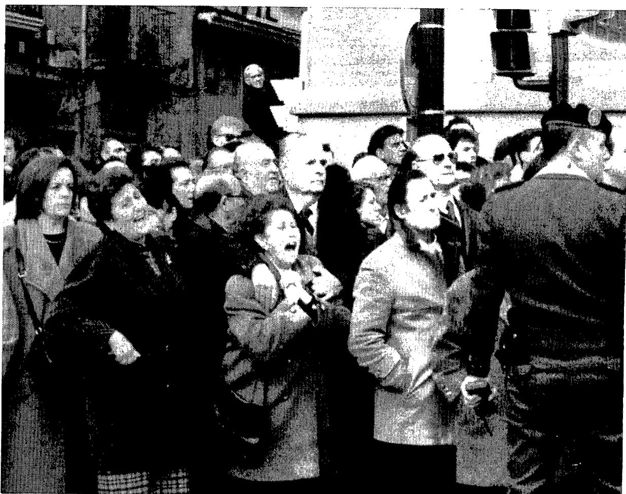
Los familiares de los policías no pudieron contener su emoción

Por otra parte, en los porches del mercado central, donde cada domingo se instalan las paradas de antigüedades, sellos, numismática, minerales y libros de ocasión, el atentado fue el protagonista de las conversaciones de los cientos de personas que lo visitan. Incluso hubo quien afirmó que "en Sabadell nunca pasa nada, pero cuando ocurre algo somos portada en todos los periódicos". En este sentido, el único precedente de atentado terrorista se remonta al año 1980, cuando el policía municipal Joan Bisbal fue asesinado por el Grapo.