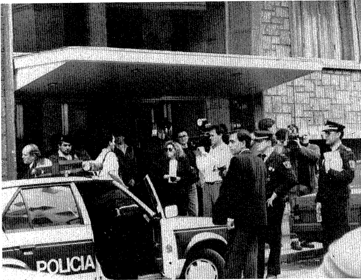
En este edificio se recibió el paquete bomba que hirió de gravedad al magistrado Fernando de Mateo

Según el conserje, en otras ocasiones el magistrado había recibido paquetes que parecían contener libros o revistas, pero siempre los entregaba al policía de escolta para ser inspeccionados. Según informa Efe, la policía ya había explotado en una ocasión anterior un paquete di-