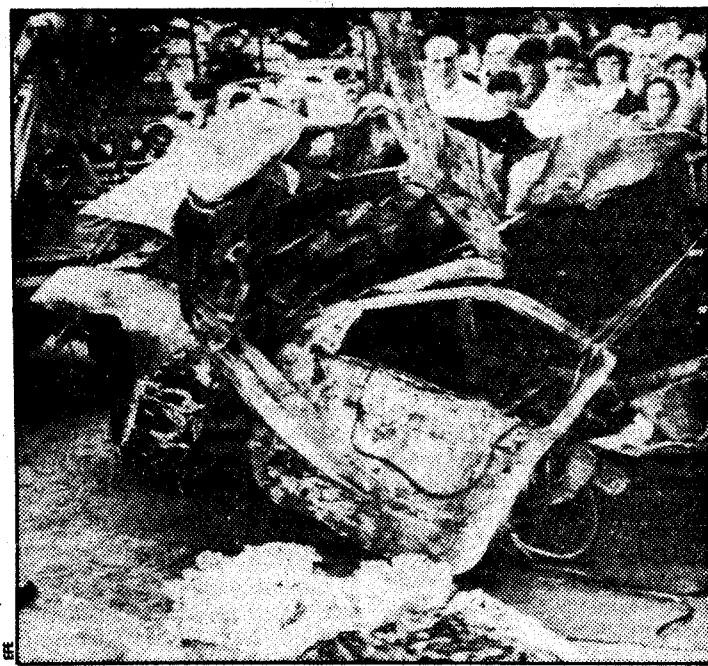
Los restos del coche bomba que hizo explosión en Hipercor