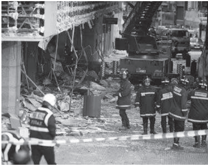
La zona que sufrió más destrozos quedó inmediatamente acordonada por la policía

Eran las 6.10 horas cuando en las sedes de la delegación del Gobierno, de los bomberos municipales y del 091 se recibían otras tantas llamadas alertando sobre la presencia de un coche bomba en la calle del Carmen, junto a la plaza del Callao, entre los edificios de El Corte Inglés