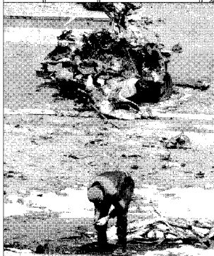
Restos del vehículo tras la deflagración