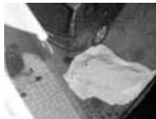
El atentado de Martín Carpena

estallar un coche bomba en el corazón de Madrid