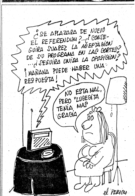
(Prohibida la reproducción sin autorización expresa de «La Vanguardia».)