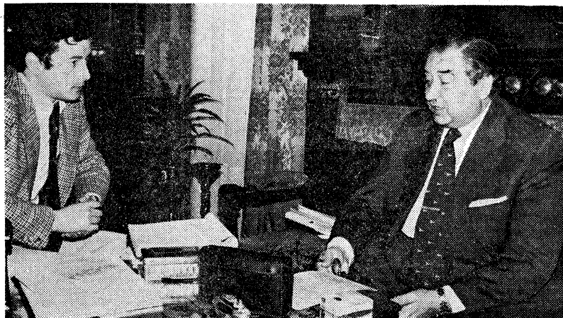
Esta es la última fotografía realizada al presidente de la Diputación donostiarra, señor Araluce y Villar. Fue tomada en la mañana de ayer, minutos antes de ser asesinado, y refleja un momento de la entrevista que concedió a un periodista de «El Correo Español-El Pueblo Vasco».

—¿Por qué —preguntamos al señor Araluce— la «Mesa» ha expuesto al ministro en estos momentos, tan preocupados para la región vasca, la derogación del Decreto de 1937? ¿Acaso los responsables de este estudio se están viendo presionados por la fuerte tensión política que atraviesa la región?