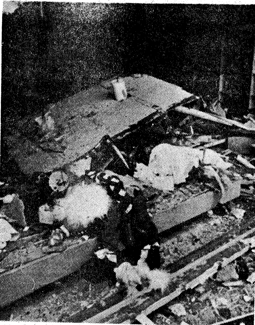
Este es el estado que mostraba, después de las explosiones del día 27, uno de los comercios de Guernica. Los establecimientos afectados fueron siete, y las pérdidas materiales se elevan a unos cinco millones de pesetas.