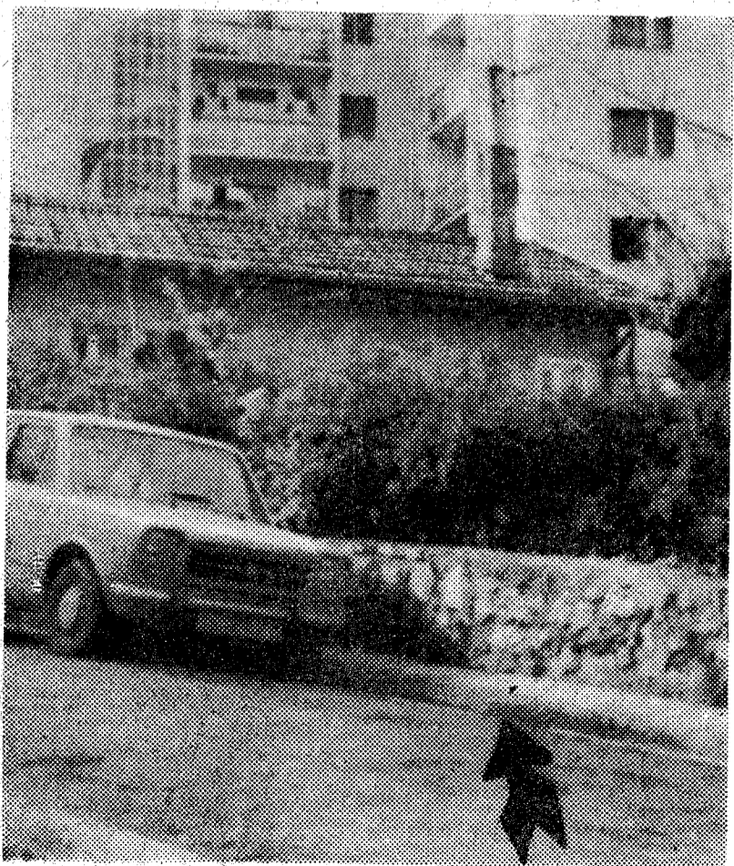
El lugar señalado por la flecha es el punto exacto en que el subinspector, señor Díaz, cayó, alcanzado por los disparos.