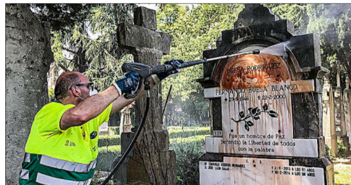
Un operario limpia ayer la pintura arrojada en la tumba de Fernando Buesa.

net, donde escribió: «Mostramos nuestro rechazo más absoluto al ataque al panteón de la familia Buesa. Toda nuestra solidaridad para con la familia». EH Bildu es socio del PSOE de Pedro Sánchez.