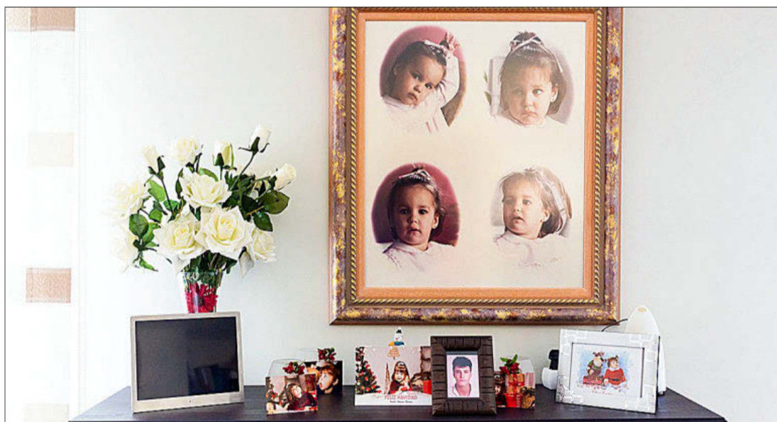
Las dos gemelas (marco grande) y el tío de las niñas (marco pequeño), todos asesinados por ETA hace hoy 32 años.

Hoy se cumplen 32 años de aquellos 250 kilos de amonal contra los Derechos Humanos. Los cuatro autores materiales y dos miembros de la cúpula llevan muchos años en la cárcel. Pero el capo de aquella ETA sólo desde el 17 de mayo de 2019,