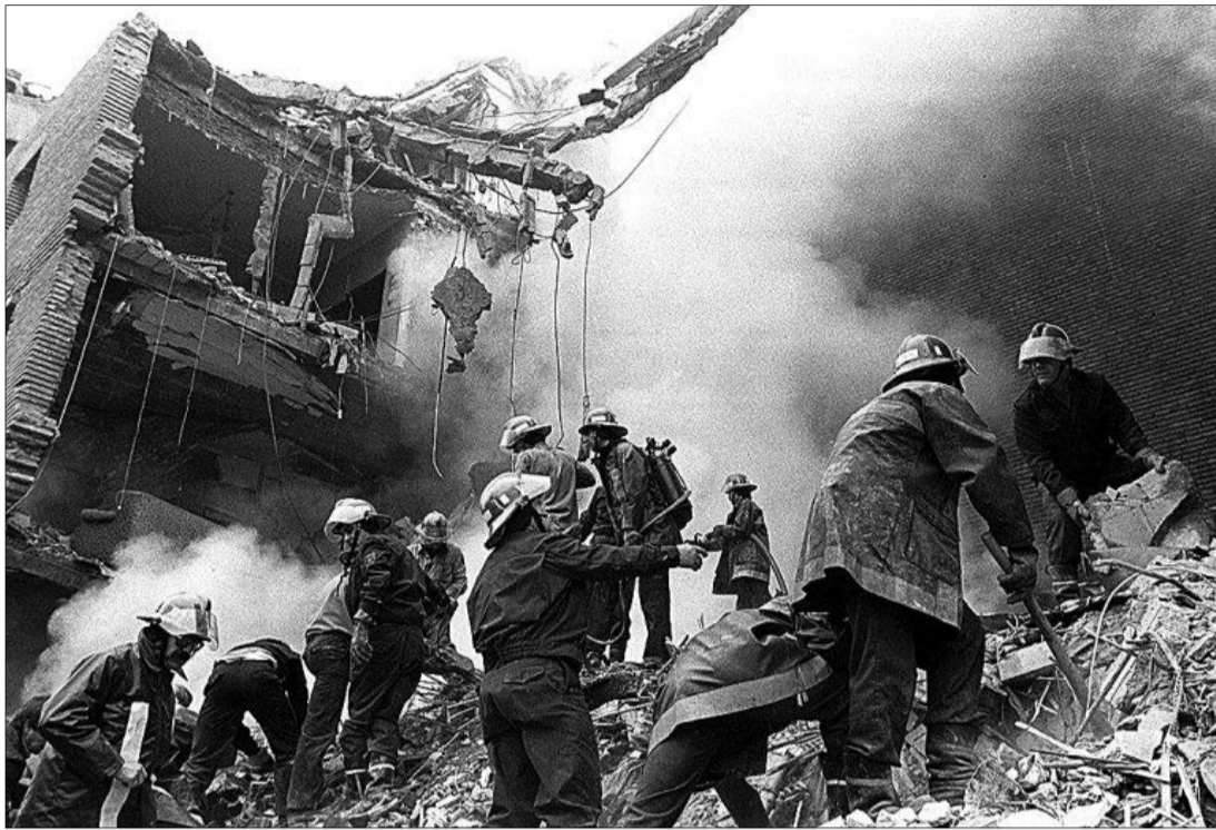
Los bomberos trabajan en la casa cuartel de Zaragoza, minutos después del atentado que dejó 11 muertos y 88 heridos.

En las semanas previas, el contacto con el Gobierno se había roto y la banda quiso golpear en mayúsculas.