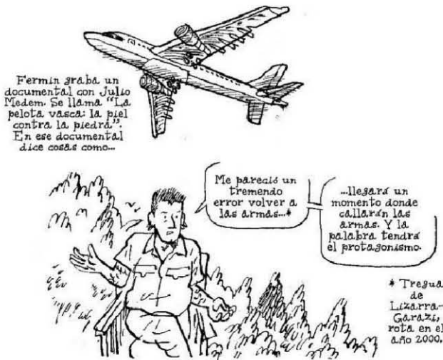
Llega el mes de julio. Fermín regresó a Euzkadi.

del siglo XX y Muguruza era denunciado por el general Rodríguez Galindo por «difamar su buen nombre» en una canción. Por ejemplo, cuando Madina sufrió el atentado con aquella bomba lapa