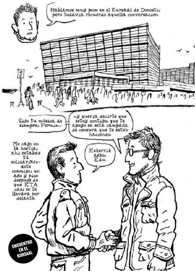
ENCUENTRO EN EL KURSAAL