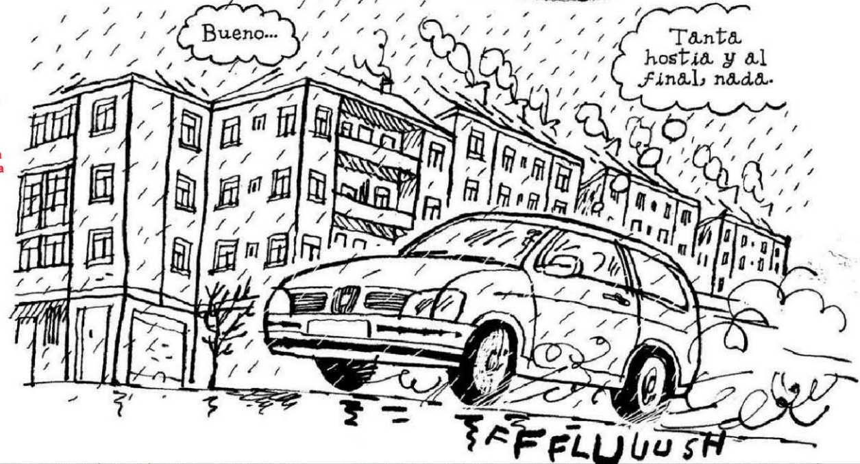
Viñeta del momento previo al atentado con bomba lapa contra Eduardo Madina.