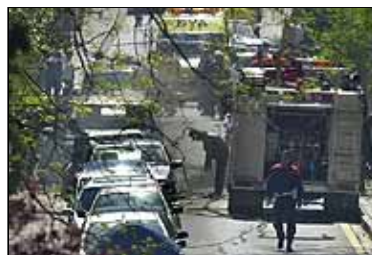
Efectivos de la Ertzaintza y de los bomberos, en la zona de la explosión.

Zarraoa afirmó que la onda expansiva ha causado "destrozos importantes" en dos