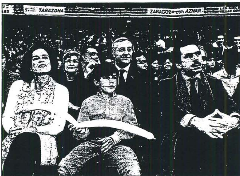
Aznar, acompañado de su esposa y su hijo Alonso, durante el mitin de ayer en Zaragoza.

Indicó que él habla de progreso de verdad, del que ha generado 1.800.000 puestos de trabajo, ha garantizado las pensiones por ley o ha originado un superávit en la Seguridad Social que ha permitido