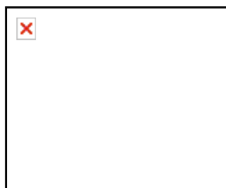
El cuerpo de Pedrosa, retratado en la parte superior de la imagen, yace en la acera.

Este partido denunció entonces la aparición en Durango de carteles amenazantes contra los cuatro concejales de su formación en el Ayuntamiento, gobernado actualmente por el PNV con apoyos de EH. «Si queréis guerra, la vais a tener», sentenciaban los pasquines.