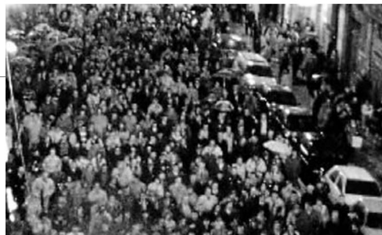
Manifestación de repulsa en San Sebastián tras el atentado.