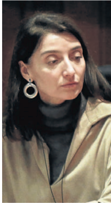
La ministra Pilar Llop.

«Leer el texto ha sido muy decepcionante. No sirve para nada porque ya se está haciendo todo lo que se pide. Reclaman cosas como que se tipifique la apología del terrorismo, cuando somos de los pocos códigos pena-