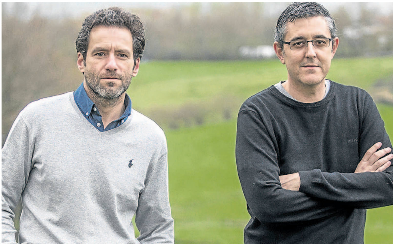
'Todos los futuros perdidos' recoge una larga conversación entre Sémper y Madina diez años después del final del terrorismo. E. C.