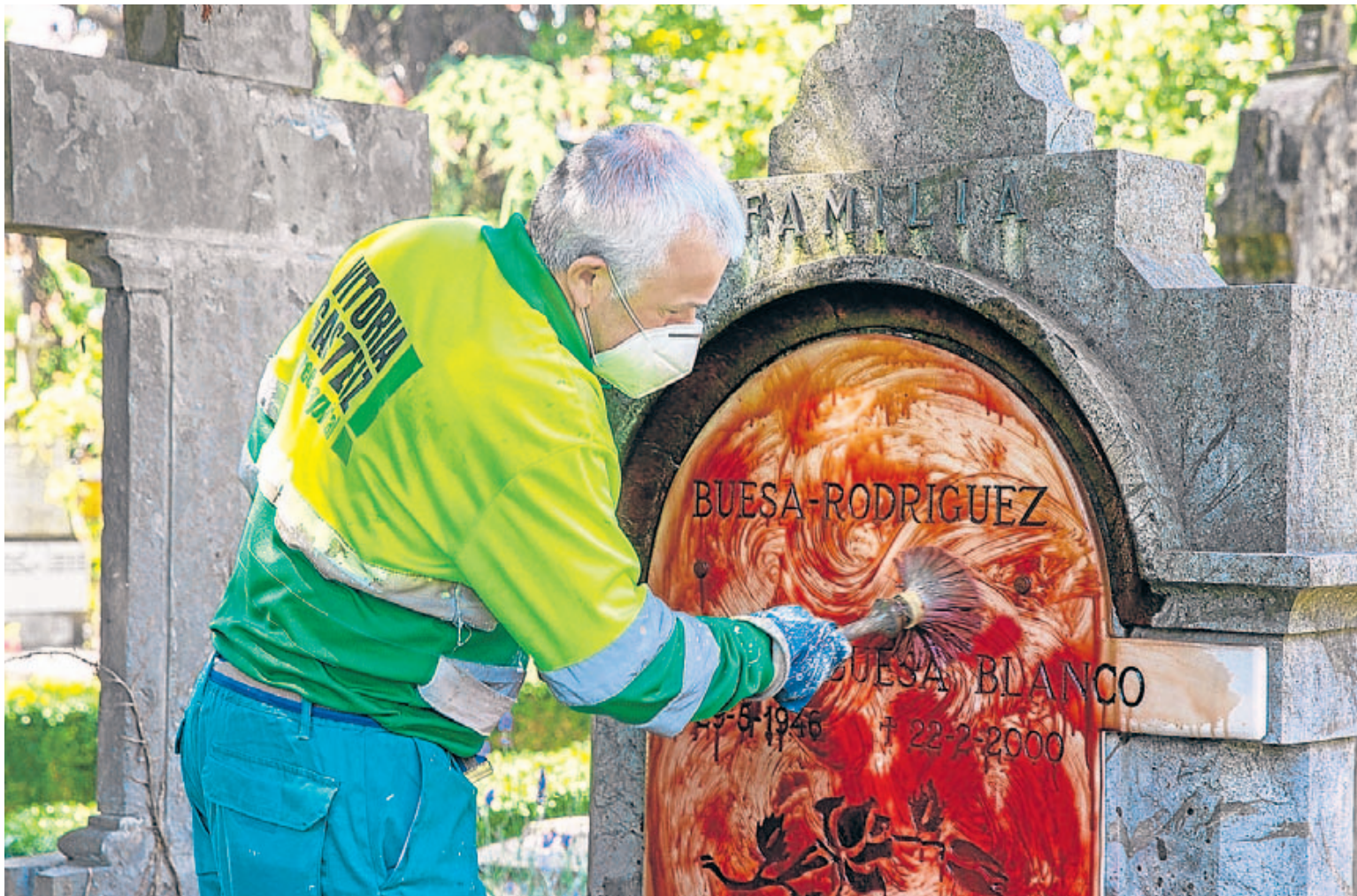
Un operario del Ayuntamiento de Vitoria trata de eliminar la pintura roja que desconocidos arrojaron contra el panteón de la familia Buesa.