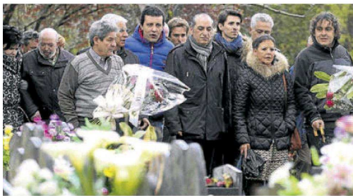
Arriola y Buen, con la familia y los allegados de Froilán Elespe.