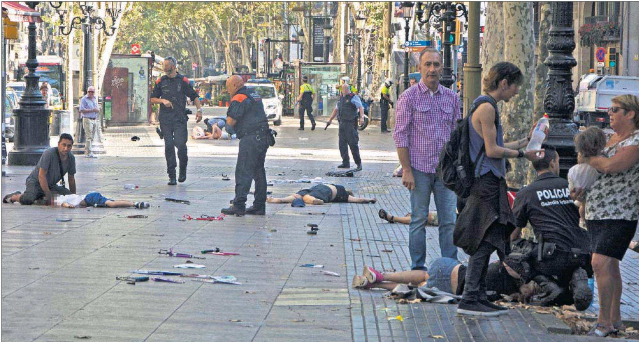
Varias víctimas del ataque terrorista de ayer en Barcelona son atendidas en La Rambla poco después del atropello masivo.

El ISIS reivindica el atropello masivo que causó 13 muertos y 88 heridos. Cuatro yihadistas, abatidos en Cambrils cuando intentaban otra masacre