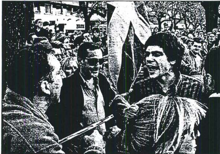
Enfrentamiento entre participantes de las dos manifestaciones paralelas de ayer en Vitoria.