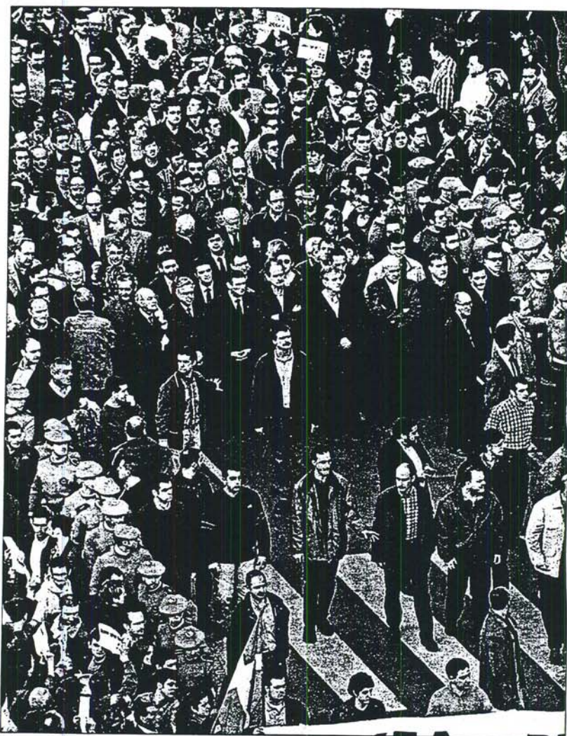
Cabecera de los nacionalistas en la doble manifestación de Vitoria. En el centro, Juan José Ibarretxe.

La marcha del PNV dejó en segundo lugar la protesta contra ETA para dar prioridad al apoyo al lehendakari. El pasado miércoles, miles de personas le increparon cuando entró a la catedral de Vitoria para asistir a los actos fúnebres por el socialista asesinado y tuvo que abandonar la iglesia por la puerta de atrás. El PNV no