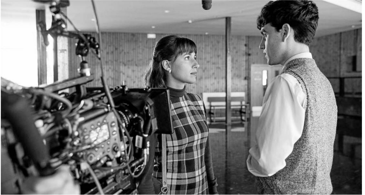
Imagen del rodaje de 'La línea invisible', serie de Mariano Barroso producida por Movistar en la que se recreaba la vida de Txabi Etxebarrieta y los inicios de ETA.