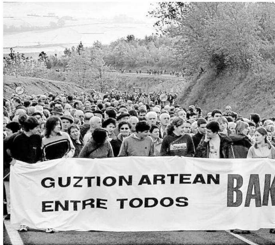
La sociedad civil de Euskadi nunca ha dejado de reclamar a ETA que se disolviese.

en 2011 un proceso, por entregas con el fin de imponer su relato en que aparecen entre las víctimas. Es un relato que justifica, en una sociedad libre, la muerte, y el secuestro y elimina la necesidad de pedir perdón. Frente a esto, hay que decirle que su fin exige que admitan el verdadero relato y realicen una petición sentida de perdón, a todos, por el infierno de dolor y sufrimiento que han producido. “Deben decir que lo hecho no puede ni debe volver a producirse y nunca debió de haberse dado. Si lo hacen, nuestra herencia cristiana nos dice que no hay delitos que sobrepasan la benevolencia y el perdón”, apostilla.