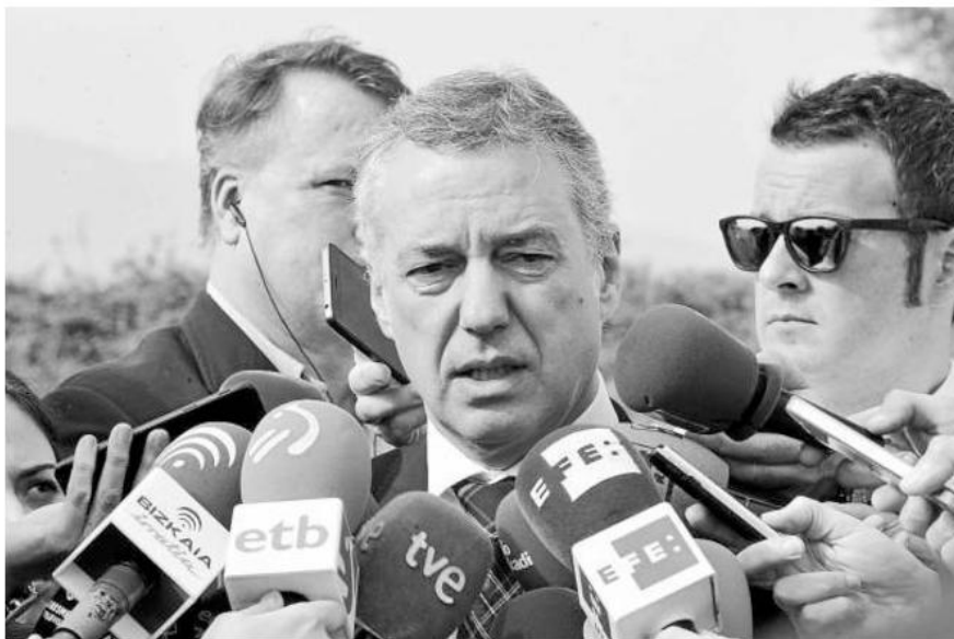
Iñigo Urkullu atiende a los medios ayer en Abanto-Zierbena.

Señaló por ello que se reserva para hacer una valoración “sopeada” ante la sociedad vasca “cuanto ETA proclame su final definitivo de manera unilateral”. “Hasta entonces considero que, siendo un paso el que hoy –por ayer– hemos conocido, ETA o quienes redacten los comunicados tiene oportunidad para, en el momento de la declaración definitiva de su final de manera unilateral, tener en la misma consideración a todas las víctimas y para reconocer el daño injusto causado por su actividad”, manifestó al respecto.