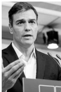
Pedro Sánchez.