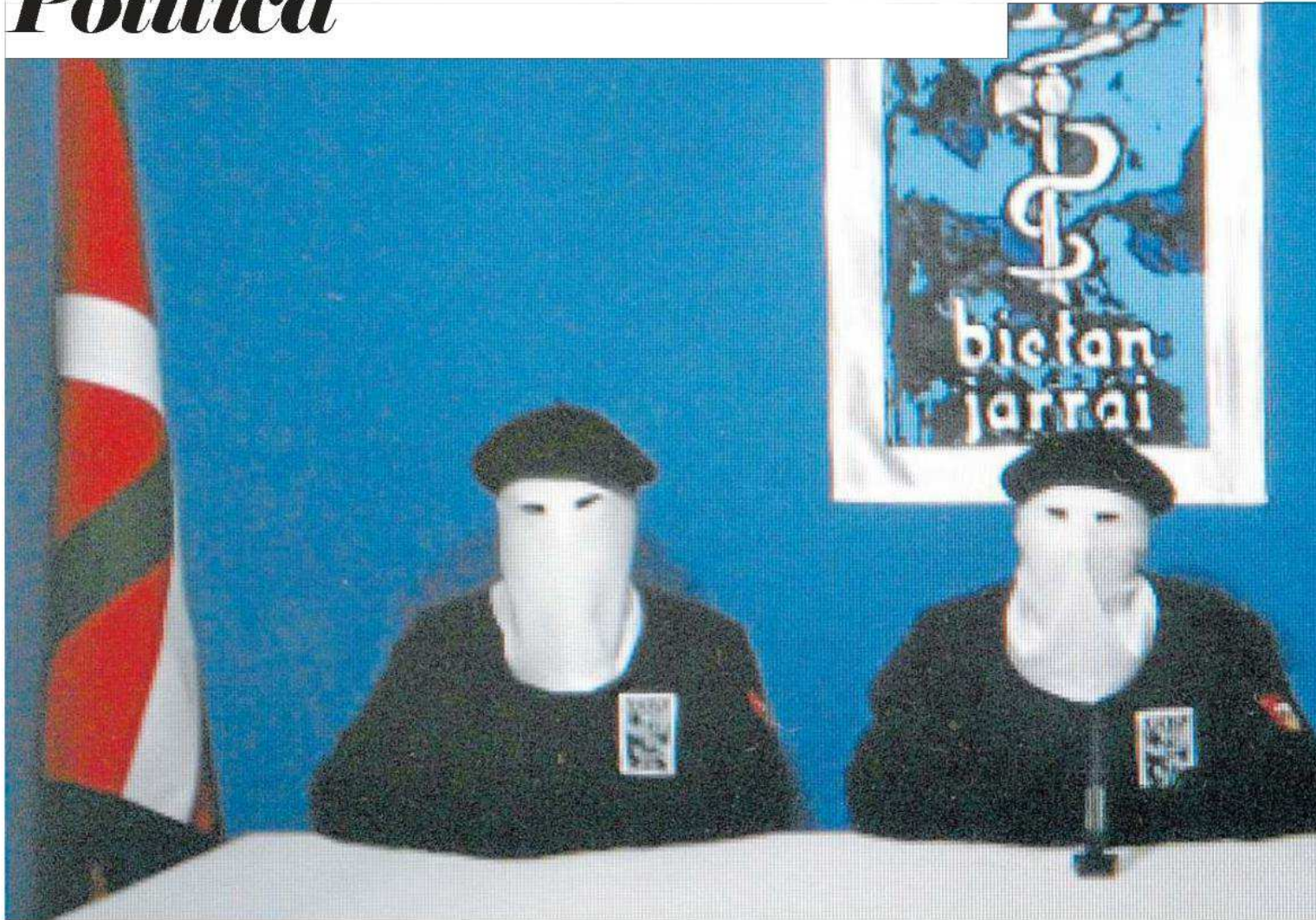
Tres miembros de ETA encapuchados leyeron la declaración de cese de su actividad armada el 20 de octubre de 2011, emitida por la 'BBC' británica.