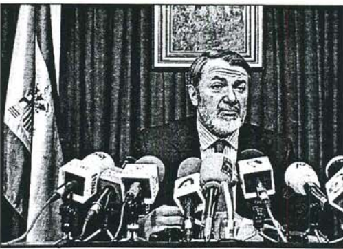
Jaime Mayor Oreja, cabeza de lista por Bizkaia

En opinión de Mayor Oreja, sería un « escándalo » porque el PNV « ha decidido jugar una apuesta en la radicalidad ». En este sentido, añadió que él estaría engañando a la sociedad vasca y española si dijera que se puede manifestar exactamente de la misma manera que una persona que, aunque esté con él en la calle en Gasteiz, « políticamente está con ETA, con Estella. Me parecería un fraude que a eso le quitásemos importancia »,