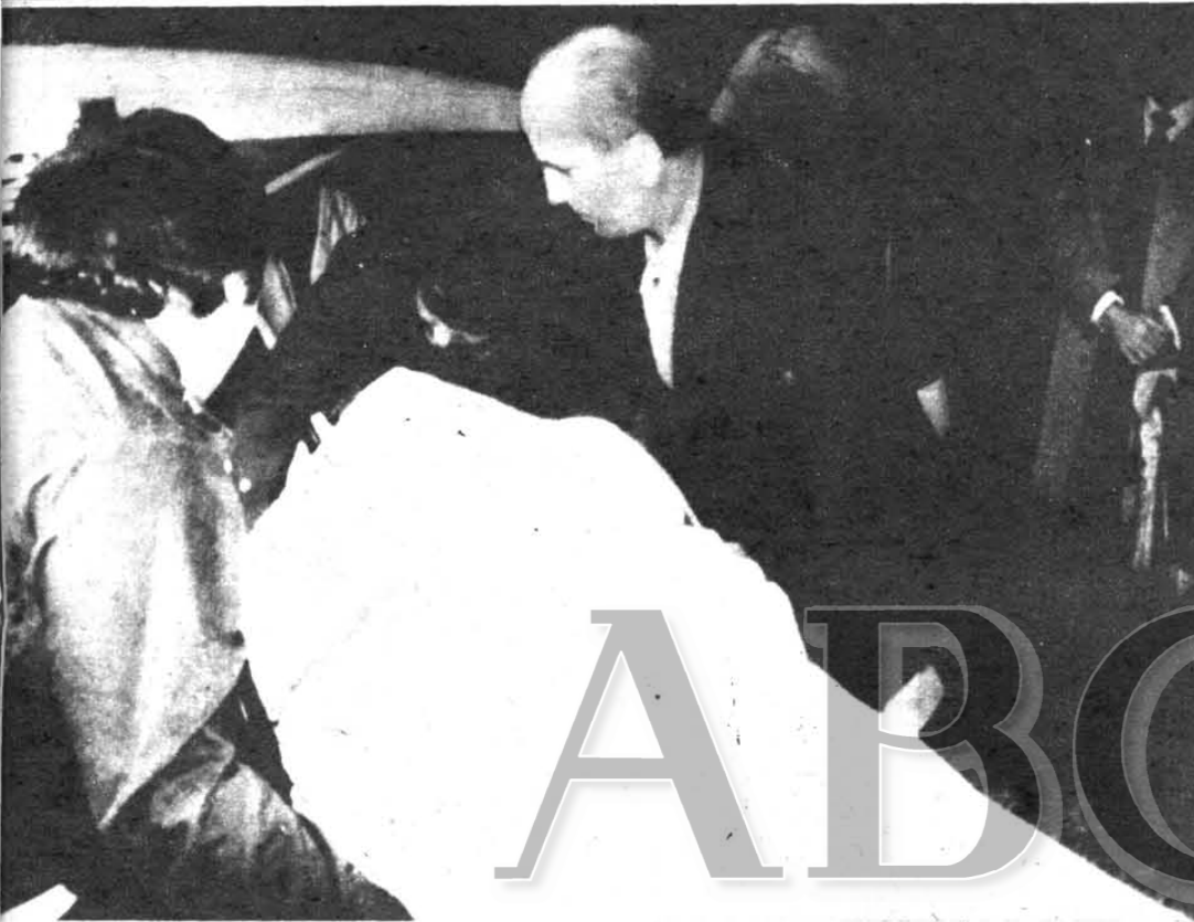
El cadáver del presidente de la Diputación de Vizcaya es introducido, envuelto en una sábana, en un furgón para trasladarlo a su domicilio. Bajo estas líneas, el automóvil en que viajaban los dos guardias civiles asesinados.