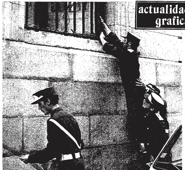
Estas dos imágenes dan una idea de la fuerza de la onda expansiva. A la derecha, soldados de la Cruz Roja retiran cristales rotos de la fachada de la Dirección General de Seguridad. Arriba, muebles y enseres del restaurante Rolando, lanzados violentamente al otro lado de la calle, se estrellaron contra la fachada de la Dirección General.