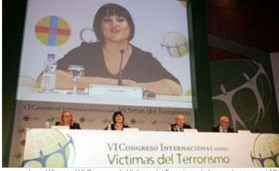
Irene Villa, en el VI Congreso de Víctimas del Terrorismo de la pasada semana