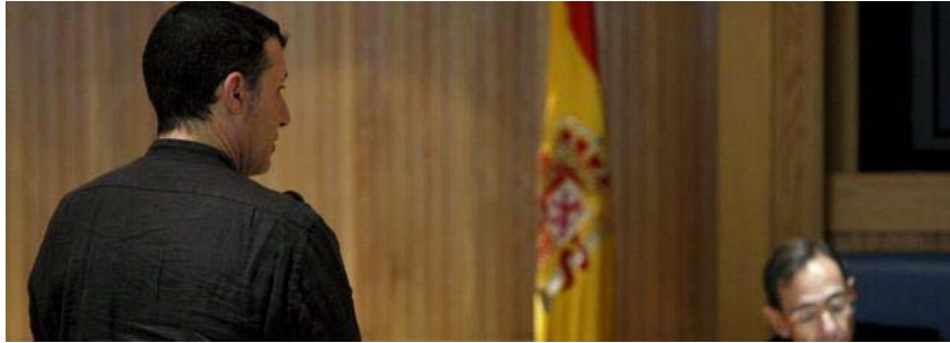
M.L.G., hoy en el juicio en la Audiencia Nacional

EFE | SEVILLA Publicado Lunes , 15-02-10 a las 16 : 40