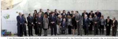
Los Príncipes de Asturias posan en una fotografía de familia junto al resto de autoridades políticas, organizadores y víctimas del terrorismo

El dolor que provoca «redobla nuestra determinación de borrarlo de la faz de la tierra»