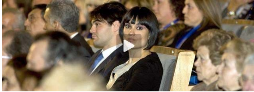
Irene Villa, en el VI Congreso de Víctimas del Terrorismo que se celebra hasta mañana en Salamanca

Irene Villa, aquella frágil niña de 12 años que perdió las piernas tras el azote etarra, es hoy una inteligente mujer que habla claro: «No creo en la cadena perpetua, sino en la reinserción de los presos y el cumplimiento íntegro de las penas, pero el dolor de una víctima nunca prescribe»