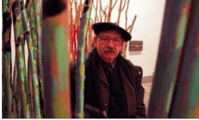
El escultor vasco Agustín Ibarrola

El artista vasco denuncia la situación en la que han vivido hasta las pasadas elecciones las personas amenazadas por la banda terrorista