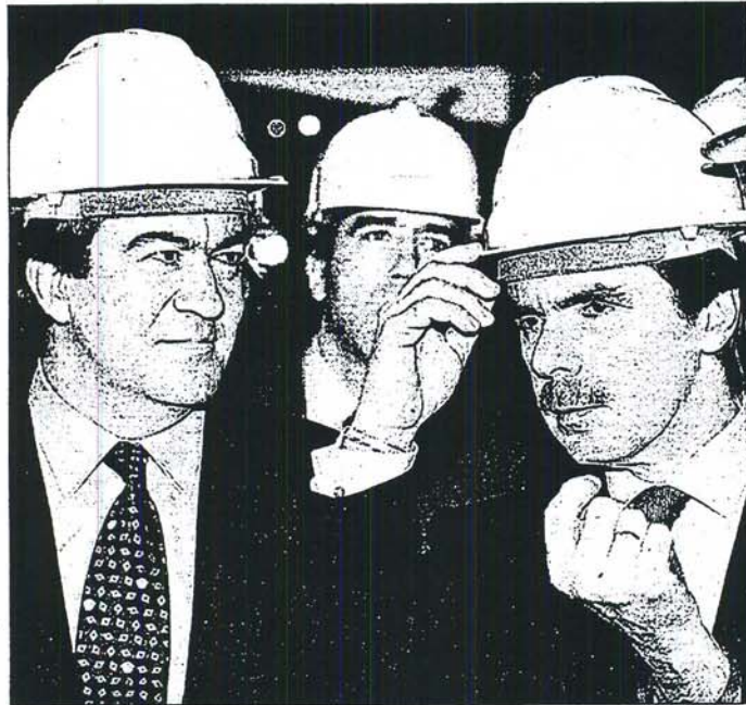
Aznar y Cascos, ayer, en la factoría de Aceralía de Gijón

Piqué advirtió a Ibarretxe de que ni el PP ni el PSE van a apoyar a su Gobierno, e incluso dejó caer la posi-